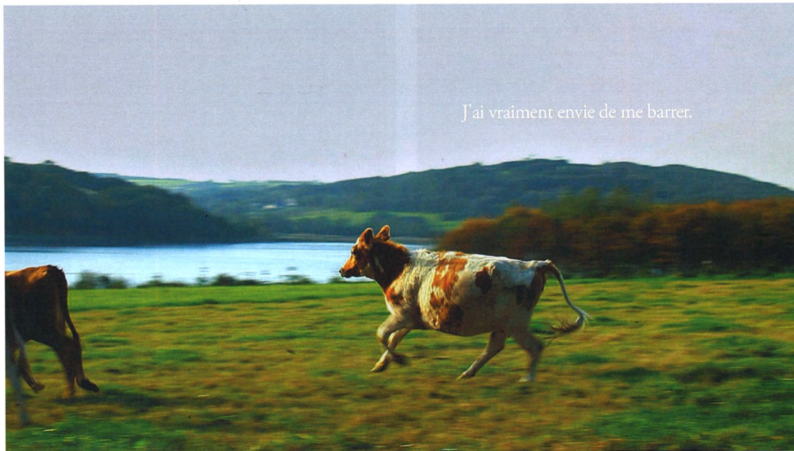
On suit la course de la vache qui dévale le champ, dévoilant un lac en arrière-champ. Texte : « J'ai vraiment envie de me barrer. »